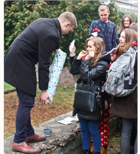
▲ „Капсула мрій” першокурсників

У більш камерній обстановці студенти продовжили святкування вже після пар разом із викладачами своїх кафедр. Принаймні так День студента відзначали на кафедрі „менеджменту персоналу та адміністрування“ (ІНЕМ) та на кафедрі „політології та міжнародних відносин“ (ІГСН).